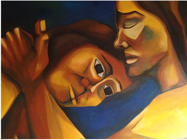
Imagen N°3 Pintura que conforma la imagen de la bandera del grupo