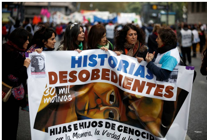
Imagen N°1 Hijas e hijos de represores en Ni una Menos, con cartel de Milagro Sala.