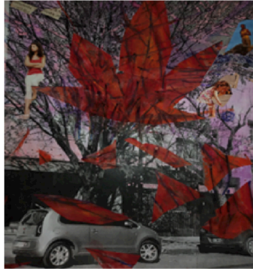
SILVIA FOTOGRAFÍA INTERVENIDA

En segundo lugar se presentan cartografías: mapas construidos a partir de los recorridos propios de los espacios públicos, construidos por las diferentes vivencias y derivas de los participantes. La idea de territorialidad fue central en los talleres y se vislumbra en la muestra. Las diversas cartografías recuperan lugares centrales para los vecinos