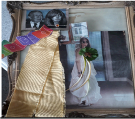
ELENA FOTOGRAFÍA INTERVENIDA