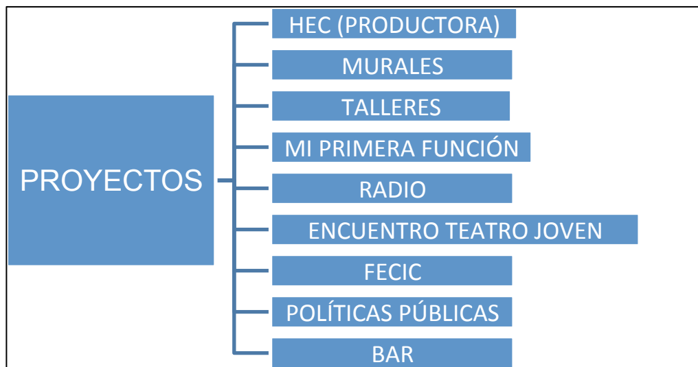
Figura 3: Proyectos del Espacio de debate y cultura La Casa.

En el 2012 los vecinos dieron origen a una pequeña productora llamada Hecho en Claypole con el objetivo de llevar adelante los proyectos de: radio, cine y ciclos de jazz. De esta manera, produjeron documentales sobre el barrio, discos de bandas que tocaron en el auditorio y en el 2015 gestaron la radio online que se escucha únicamente a través de www.hecultura.com/radio (ver tabla 1).